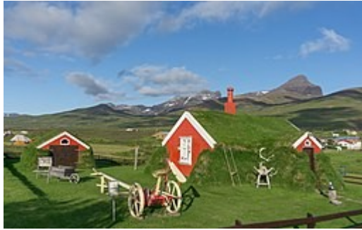
Een turfhuus in Bakkagerði, IJsland. Foto van Michal Klajban

zijn met grond en begroeiing langs de muren en het dak. Zij hebben dan ook iets weg van de weliswaar fictieve huisjes van de hobbits in Lord of the Rings. Voorbeelden van zulke begroeide huizen zijn te vinden in de turfhuizen in IJsland of de huizen ontworpen door architect Peter Vetsch.