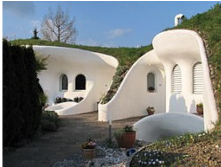
Huizen ontworpen door Peter Vetsch in Zwitserland.